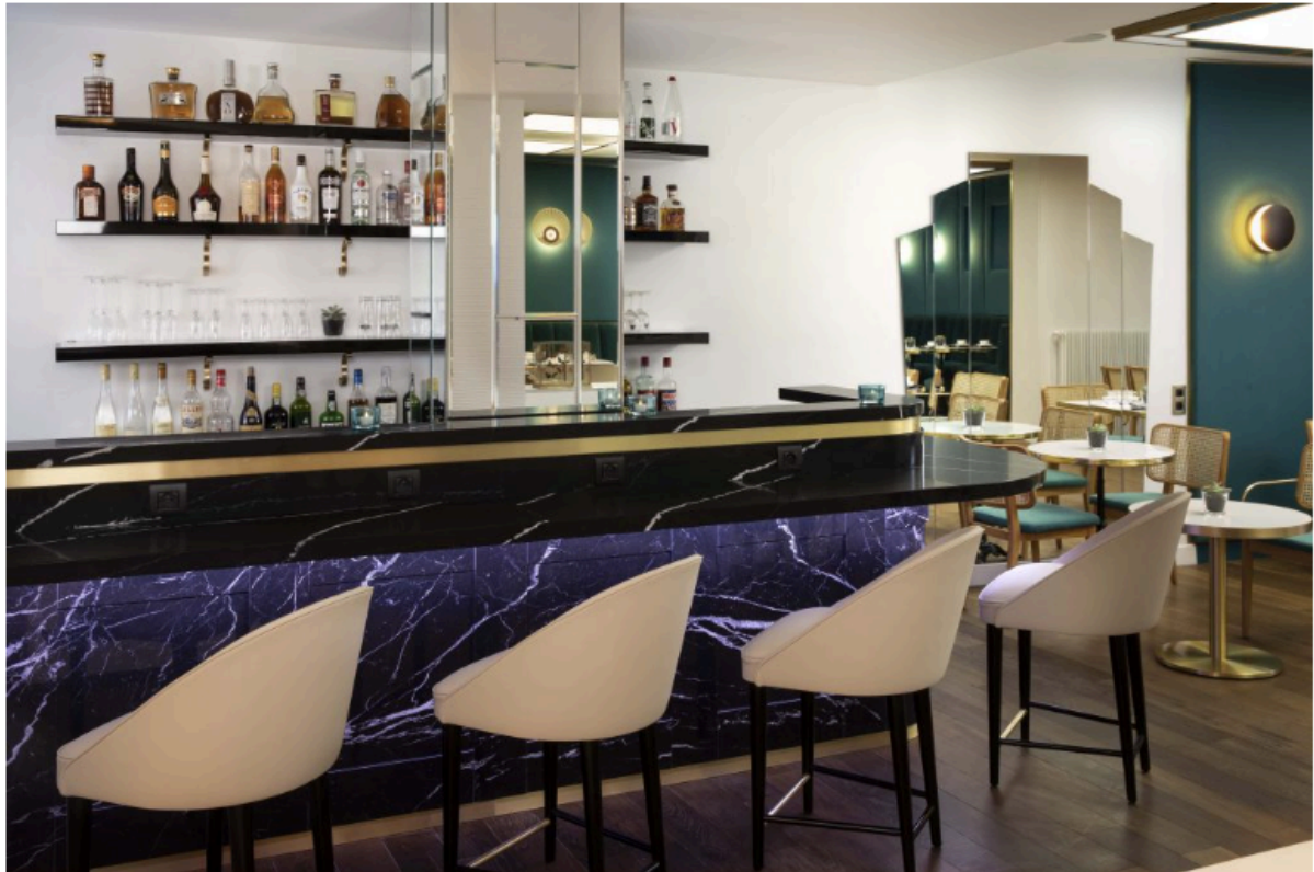
Bar les Contemplations – Bielsa

Les murs gainés de velours et les claustras en lames de miroir soulignent la sophistication de l'atmosphère Art Déco, engendrant une fertile conjugaison de styles mettant en valeur le caractère unique du lieu.