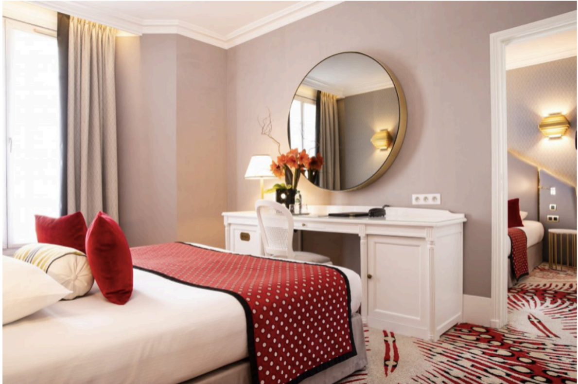
Chambre Rouge avec vue – Bielsa