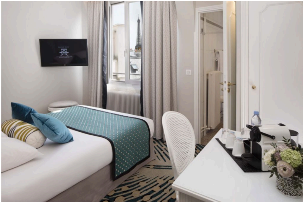
Chambre bleue lit simple vue sur Tour Eiffel – Bielsa