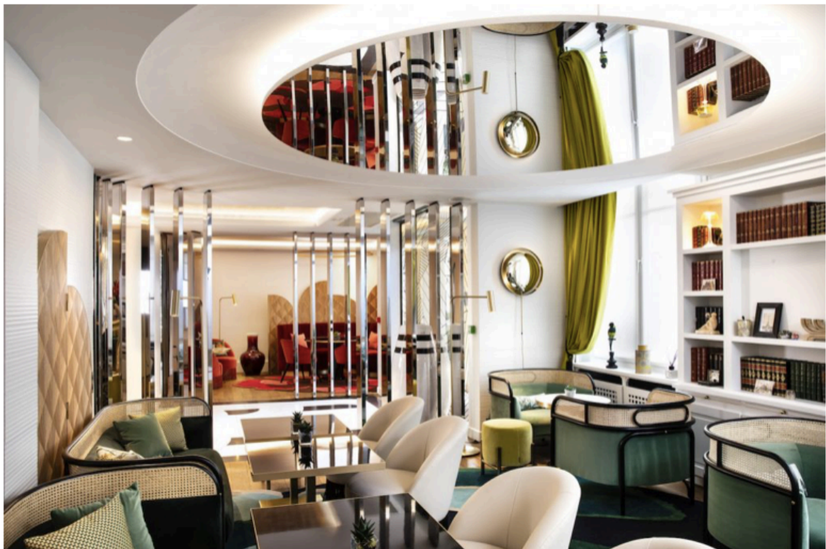
Lobby vert - Bielsa

Loin du pastiche, la démarche ornementale autour des motifs se développe dans un esprit contemporain, habillant les espaces intérieurs de parures. L'espace du lobby se voit sculpté par les jeux de contrastes des revêtements et les gammes colorées s'érigent en éléments structurants. Un somptueux tapis de marbre noir et blanc se déploie dès l'entrée lumineuse de l'hôtel, ouvrant sur des salons boudoirs monochromes qui élargissent la palette chromatique : le vert émeraude se conjugue au céladon, le rouge d'Andrinople côtoie le rose Givenchy.